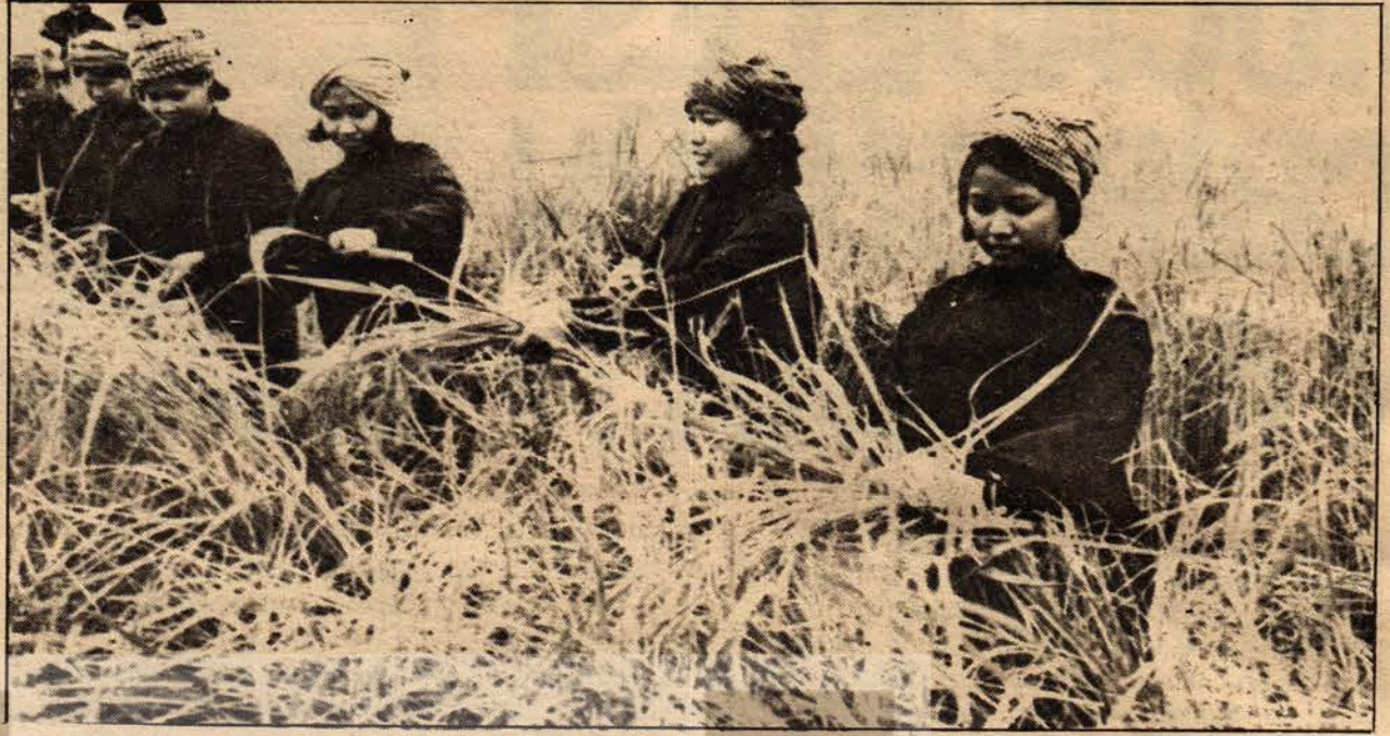
Tarlada çalışan Kamboçyalı kadınlar

Ülkemizi savunmak için sayısız güçlüklerin üstesinden gelmemiz gerekti. Zaferin meyvalarını tam bir başarıyla savunduk, Partimizin işçi-köylü iktidarını savunduk, bugünkü sınırlarıyla Demokratik Kamboçya'nın bağımsızlığını, egemenliğini ve toprak bütünlüğünü koruduk ve tam bir bağımsızlığa ve egemenliğe sahip olduk. Ülkemizin her yerinde güvenlik tamamen sağlan-