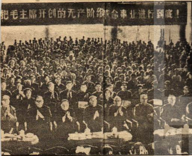
larla Pekin'deki bir toplantıda

birleşik cephenin kurulması, yiğit bir devrimci ordunun kurulması ve toplumdaki sınıfların tahlil edilmesi, çelişme, pratik, köylük bölgelerde devrimci üs bölgelerinin kurulması, devrimci mücadelede köylük bölgelerin ve şehirlerin rolü, devrimci şiddet, halk savaşının strateji ve taktikleri, devrimci kültür, edebiyat ve sanat vb. konularındaki öğretilerinden oluşmaktadır.