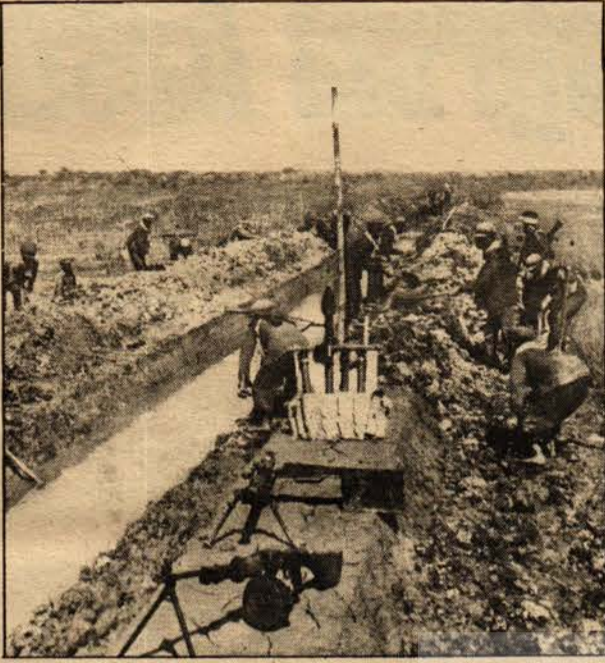
Kamboçya Halk Ordusu, ülkenin, yeniden inşası çalışmalarında

sağlamlaştırmaya ve geliştirmeye devam edeceğiz, büyük, orta büyüklükte ve küçük sanayiden ve el sanatlarından oluşan bir ağ bütün ülkeyi kaplamaktadır. Halkın geçimini sağlama sorununu başarıyla çözdük ve herkese tahıl temin edilmesini güvence altına alarak ve halkın sağlık koşullarını gittikçe daha iyi hale getirerek halkın refah düzeyini yükseltmeye devam ediyoruz. Sıtmayla savaş için yapılan dört yıllık planın ilk yılı olan 1977'de daha şimdiden hedeflerimizin yüzde 70-80'ini gerçekleştirdik. Diğer hastalıklar ve özellikle eski toplumdaki miras kalan hastalıklar da esas olarak yok edilmiştir. Yalnız belli yerleşmiş hastalıklara karşı hâlâ savaşmamız gerekmektedir. Gerek Pnom Pen'de gerekse ülkedeki bütün yörelerde, bölgelerde, illerde ve kooperatiflerde bir hastane ve ilaç merkezleri ağı bulunmaktadır. Her kooperatifin kendi hastanesi ve eczanesi vardır. Ortalama olarak, kooperatiflerdeki her yüz aileye, öğretimden geçmiş üç sağlık görevlisi olan yirmi yataklı bir klinik ve üç eczacısı olan ve bitkilerden ilaç yapan bir imalathane düşmektedir. Bitkilerden yaptığımız ilaçlar ülke ihtiyacının yüzde 80'ini karşılayabilmektedir. Hastane ve eczane sistemimizi daha hızlı bir biçimde geliştirmek ve daha yüksek bir düzeye çıkarmak için çaba harcıyoruz. Önümüzdeki on yıl içinde nüfusumuzun 15-20 milyona ulaşacağını umduğumuz için, halkımızın yaşam ve sağlık koşullarını düzeltmeye çalışıyoruz.