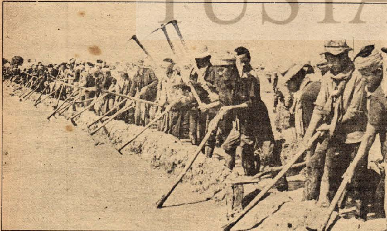
Kanal inşasında çalışan işçiler

Sanayi ve el sanatlarını Pnom Pen'de ve yörelerde, bölgelerde, illerde ve kooperatiflerde sağladığımız ve geliştirdiğimiz ölçüde, bu konuda hızlı bir ilerleme kaydettik. İlerde de