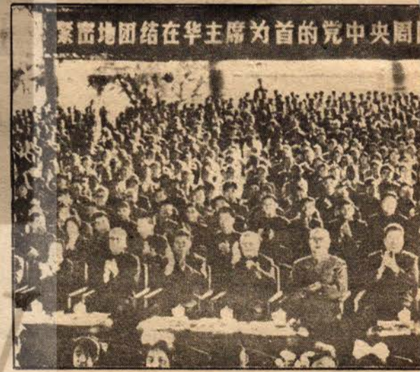
Kamboçya heyeti, Çinli

Çin Halk Cumhuriyetinin uluslararası alanda etkinliğinin ve saygınlığının arttığını görmekten