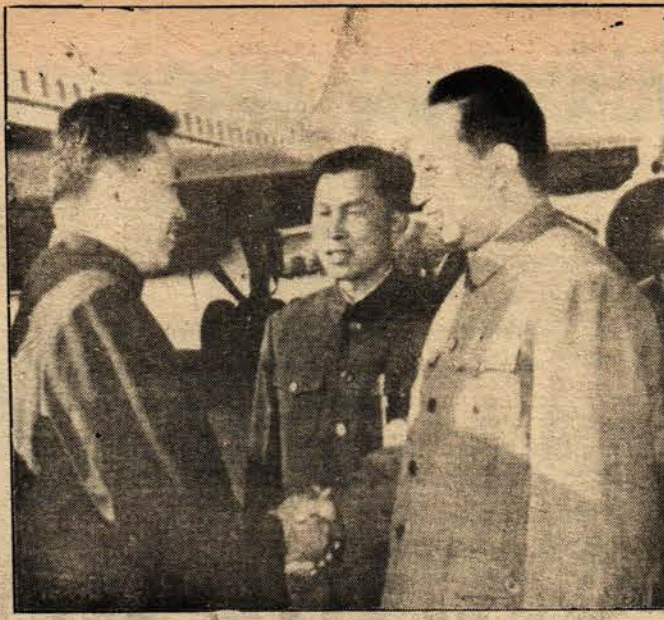
Hua Guo-feng yoldaş ve Pol Pot yoldaş Pekin havaalanında

bir değişikliğe yol açtı ve özellikle dünyanın dört bir yanındaki halkların milli ve sosyal kurtuluş uğruna yürüttükleri devrimci hareket için güçlü bir destek ve şevk kaynağı oldu. Marks, Engels, Lenin ve Stalin'den sonra Başkan Mao ve onun fikirleri, ard arda gelen devrimci fırtınaların sınavından başarıyla geçerek bütün dünyada milli kurtuluş ve halk kurtuluş devrimlerinin yolunu aydınlatan parlak bir fener haline geldi. Daha açık bir şekilde söyleyecek olursak, Mao Zedung Düşüncesi mücadelemizi şaşmaz bir biçimde zafere götüren en etkili ve keskin ideolojik ve siyasi silahtır.