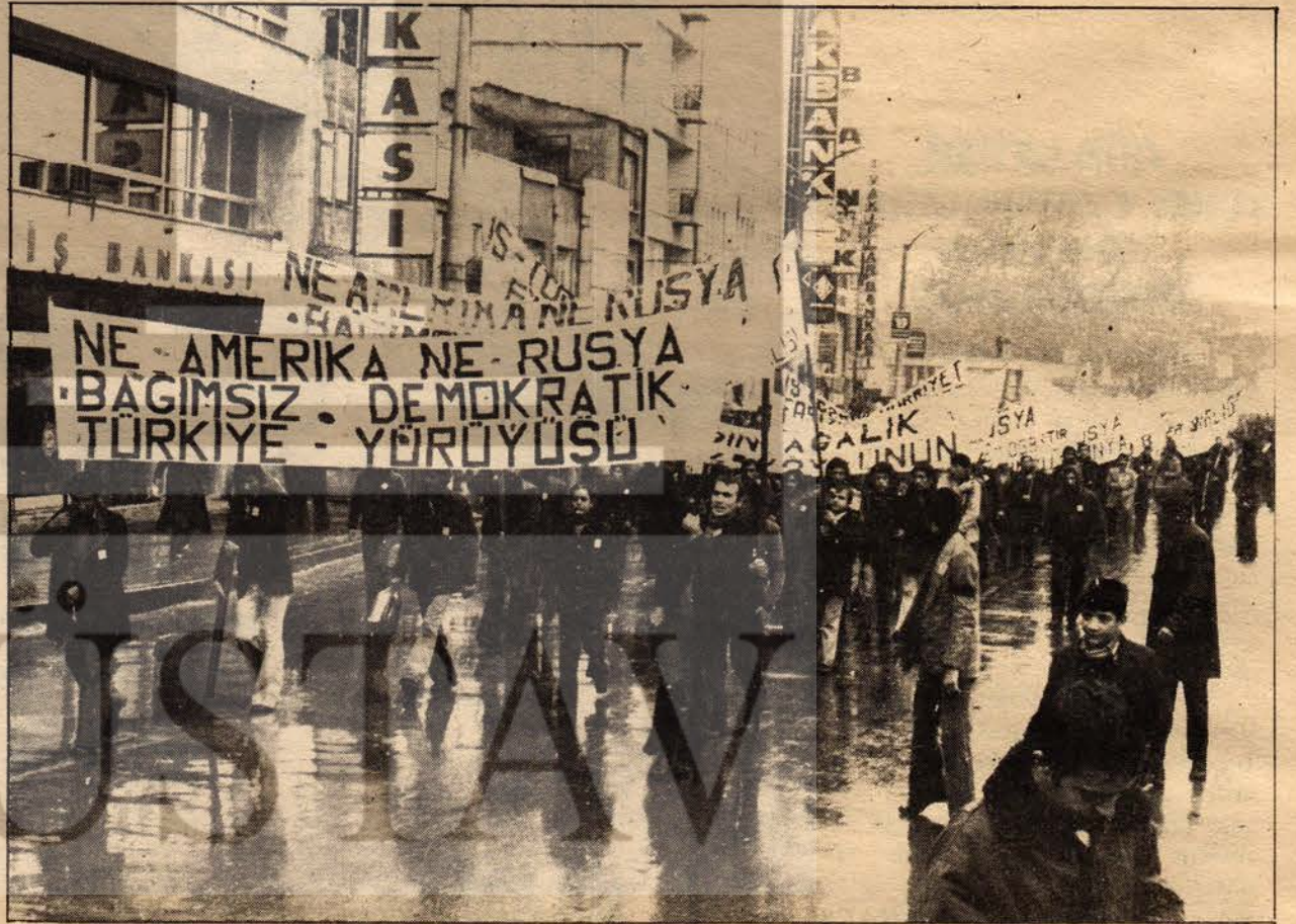
1976 yılında iki süper devlete karşı bağımsızlık bayrağına kararlılıkla sarılan DGB Karamürsel Bağımsızlık yürüyüşünde.

Gençliği emrivakiler karşısında bırakan, mücadelede bir seyirci durumuna düşüren ve pasifleştiren provokasyon eylemleri ve düello mantığı mahkum edilmelidir. Bunun yerine en geniş kitlenin seferber edildiği ve saldırgan hakettiği